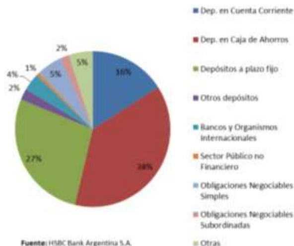
Gráfico #3: Estructura de Fondeo- Dic'17

Tradicionalmente los depósitos del banco han estado adecuadamente diversificados. Sin embargo, durante los últimos años se observa una mayor atomización debido al incremento de la base de depositantes, especialmente individuos. A dic'17 los mayores diez depositantes representan el 8% del total de captaciones y los siguientes 50 depositantes concentran el 8%.