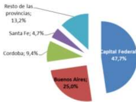
Distribución geográfica de las financiaciones - Sep'17

Con relación a la distribución geográfica de la cartera, se observa una mayor participación relativa de la asistencia en las provincias de Córdoba y Santa Fe, básicamente explicada por la implementación de nuevas líneas de negocios, tales como el leasing de ganado, en dichas provincias. A sep'17 el 47.7% de las financiaciones se concentra en la Ciudad de Buenos Aires, 25% en la Provincia de Buenos Aires, el 9.4% en Córdoba, el 4.7% en Santa Fe y el 13.2% se distribuye entre el resto de las provincias (especialmente Mendoza, La Rioja, Entre Ríos, Chaco, Río Negro y San Luis). Se considera que esta concentración implica una razonable