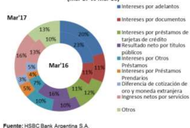
Gráfico #1: Composición del flujo de ingresos (Mar'17 vs Mar'16)

HSBC registra una buena diversificación de sus fuentes de ingresos producto de su carácter de banco universal y amplia oferta de productos. A mar'17 los intereses por adelantos representan el 20.4% de los ingresos operativos totales (vs 23.2% a mar'16), seguidos por los ingresos netos por servicios (16.3%, vs 12.9% a mar'16) y los