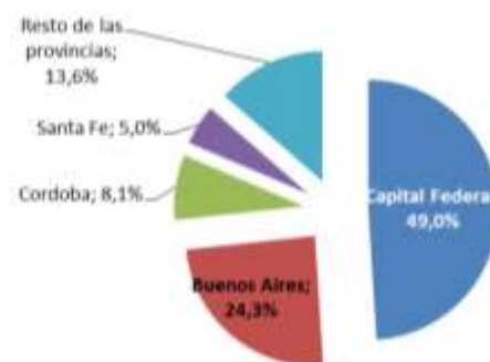
Distribución geográfica de las financiaciones - Dic'16

concentración por punto de venta, si bien aún se considera elevada, presenta una tendencia decreciente como consecuencia de la generación de nuevas alianzas comerciales. A dic'16 los primeros 10 comercializadores representan el 37.2% de la originación de CGM, vs 43.4% a dic'15. No obstante, la mayoría de los proveedores mantiene una relación comercial estable con la entidad. Por otra parte, el hecho de que en 2016 sólo el 53% de las transacciones de CGM hayan sido realizadas a través de dichas alianzas.