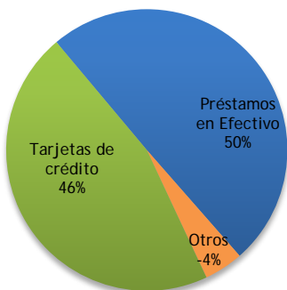
Principales productos (% sobre el total a jun'16)